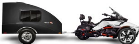
Motos trois roues