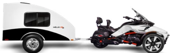
Motos trois roues